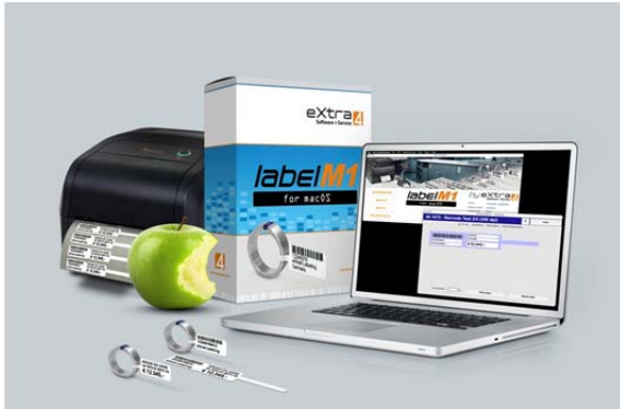
Abb.1: Etikettendruck für die Apple-Welt: Software eXtra4-labelM1 zum Auszeichnen von Schmuck und Uhren