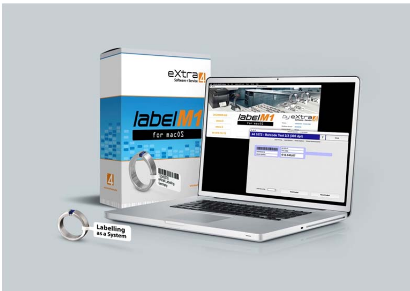
Abb.2: Für Apple-Rechner mit M-Prozessor und Betriebssystem macOS: Etikettendruck-Software eXtra4-labelM1 speziell für Juweliere und Goldschmiede.